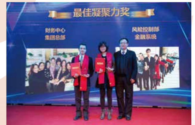
最佳凝聚力奖 集团总部财务中心 金融系统风险控制部