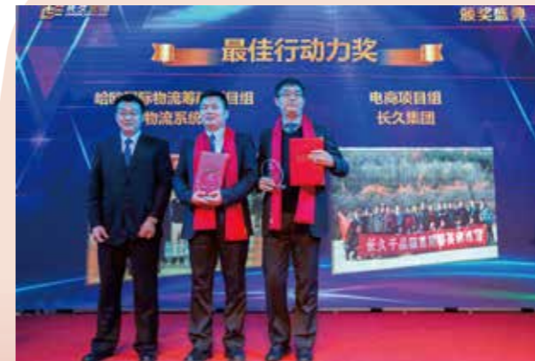
最佳行动力奖 长久物流哈欧国际物流筹建项目组 长久集团电商项目组