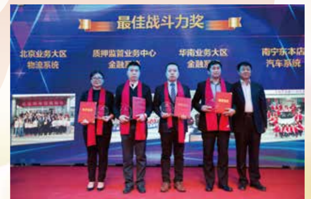
最佳战斗力奖 物流系统北京业务大区 金融系统质押监管业务中心 金融系统华南业务大区 汽车系统南宁东本店