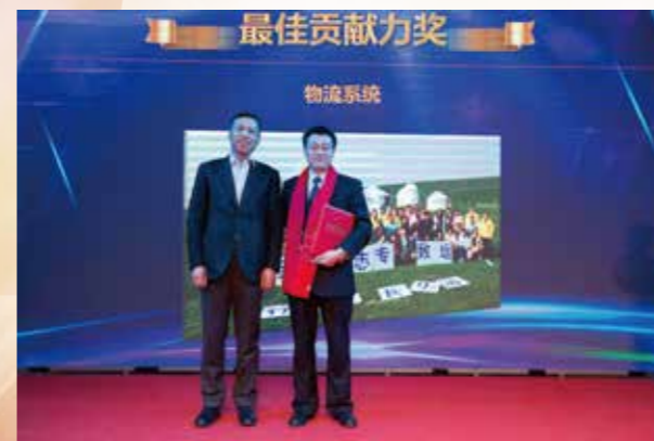
最佳贡献力奖 物流系统